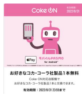
限定デザイン ドリンクチケット