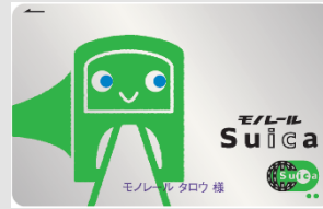
モノレール My Suica