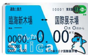
りんかい Suica 定期券