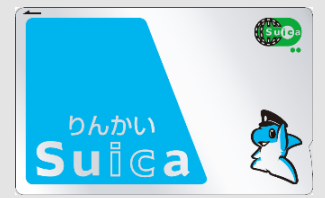
りんかい Suica カード (無記名)