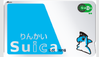
りんかい My Suica