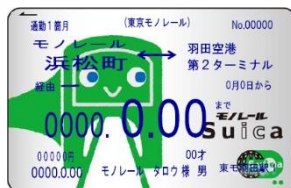
モノレール Suica 定期券

© 2023 SANRIO CO., LTD. APPROVAL NO. L642561