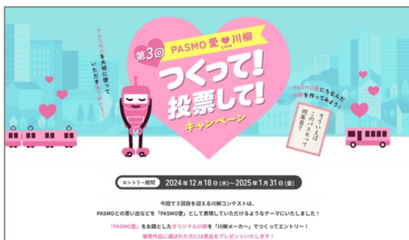
(キャンペーンサイトイメージ)

皆さまそれぞれの「PASMO 愛」あふれる作品のエントリーをお待ちしております。